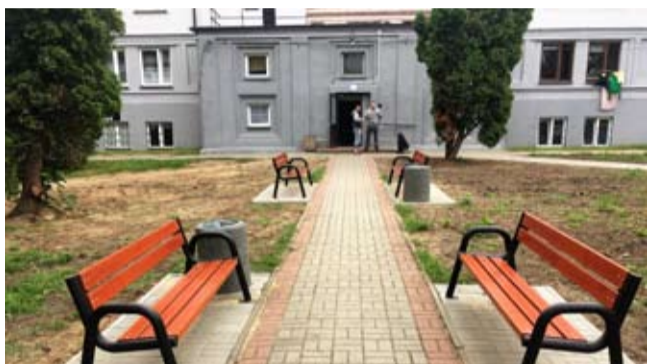
Str. 11 | Porządki pod „hotelowcem”

Nakład: 5000 szt. Wydawca: Urząd Miasta Poręba, ul. Dworcowa 1, 42-480 Poręba, tel. 32 677 13 55, fax 32 677 17 46, sekretariat@umporeba.pl, www.umporeba.pl