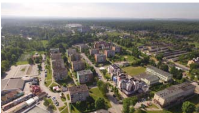
Str. 9 | Pieniądze z UE dla Poręby