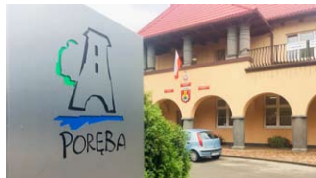
Str. 14-15 | Wybory samorządowe 2018