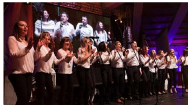
Str. 12 | Sukces na festiwalu kołęd