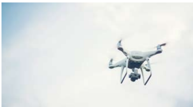
Str. 3 | Nowe możliwości walki ze smogiem

Nakład: 5000 szt. Wydawca: Urząd Miasta Poręba, ul. Dworcowa 1, 42-480 Poręba, tel. 32 677 13 55, fax 32 677 17 46, sekretariat@umporeba.pl, www.umporeba.pl