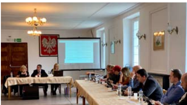
Str. 5 | Pierwsza e-sesja w Porębie