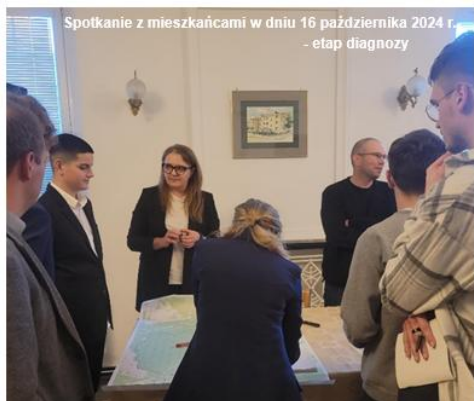
Spotkanie z mieszkańcami w dniu 16 października 2024 r. - etap diagnozy