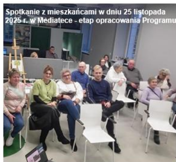
Spotkanie z mieszkańcami w dniu 25 listopada 2025 r. w Mediatece - etap opracowania Programu

Przewodniczący Zarządu Lokalni Kulturolni