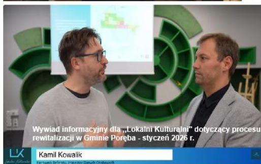
Wywiad informacyjny dla „Lokalni Kulturolni” dotyczący procesu rewitalizacji w Gminie Poręba - styczeń 2026 r.

Udział interesariuszy na każdym etapie procesu jest niezwykle ważny, dlatego liczymy na Państwa obecność i aktywne włączenie się w tworzenie dokumentu, który będzie miał wpływ na rozwój naszej gminy w najbliższych latach.