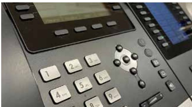
Str. 6 | Oszczędności w UM Poręba