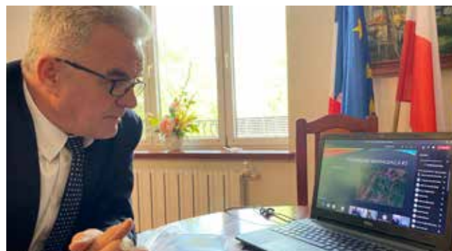
Str. 3 | Dwa ważne dokumenty dla miasta