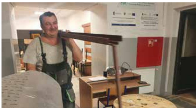
Str. 7 | Szkoły po remoncie

Nakład: 5000 szt. Wydawca: Urząd Miasta Poręba, ul. Dworcowa 1, 42-480 Poręba, tel. 32 677 13 55, fax 32 677 17 46, sekretariat@umporeba.pl, www.umporeba.pl